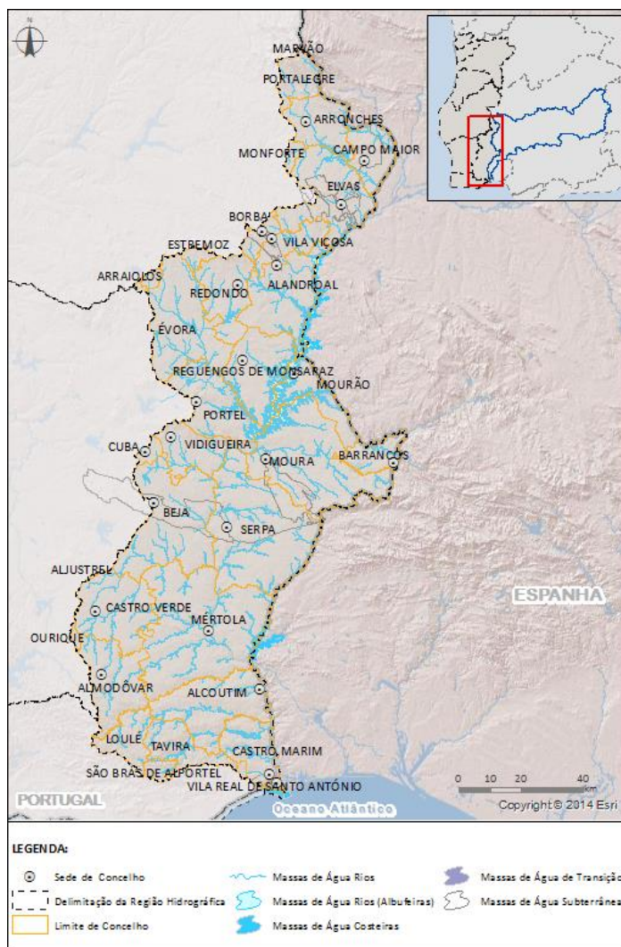
Figura 1 - Delimitação geográfica da Região Hidrográfica do Guadiana (RH7)

A Região Hidrográfica do Guadiana (RH7) é uma região hidrográfica internacional com uma área total em território português de 11 611 km 2 . Integra a bacia hidrográfica do rio Guadiana localizada em território português e as bacias hidrográficas das ribeiras de costa, incluindo as respetivas águas subterrâneas e águas costeiras adjacentes, conforme o Decreto-Lei n.º 347/2007, de 19 de outubro, alterado pelo Decreto-Lei n.º 117/2015, de 23 de junho.